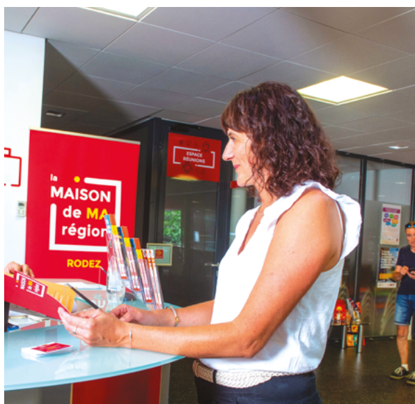
Maison de Ma Région - Rodez - Aveyron (12)