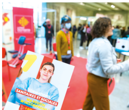
Rencontres métiers santé et social

En savoir + RDV sur laregion.fr/formations-sanitaires-sociales