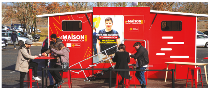
Maison mobile de l'orientation, Cahors Lot (46)

En savoir + RDV sur laregion.fr/-maisons-orientation