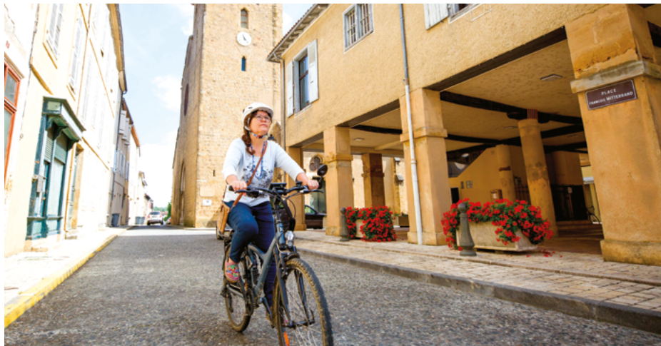
Éco-Chèque Mobilité - Masseube - Gers (32)