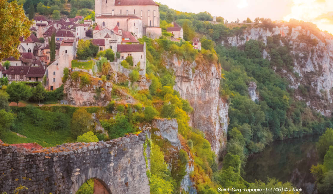
Saint-Cirq-Lapopie - Lot (46)