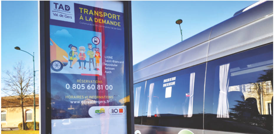
Inauguration d'un nouveau TAD Communauté de communes Val de Gers – Gers (32)