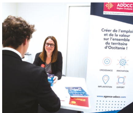
Maison de Ma Région Albi - Tarn (81)

Toulouse 05 61 33 50 90 Montpellier 04 67 22 63 97