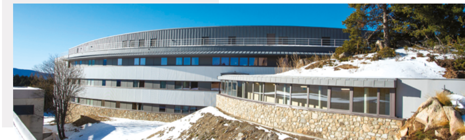
Nouvel internat du lycée climatique et sportif Pierre de Coubertin Font Romeu - Pyrénées Orientales (66)