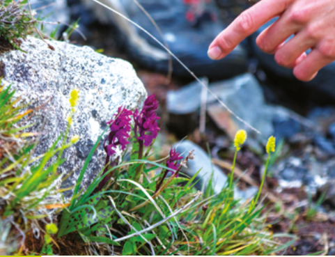
Réserve Naturelle Régionale d'Aulon Hautes-Pyrénées (65)