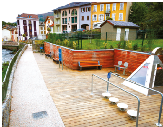
1 er parc sénior en Ariège - Ax-les-therme - Ariège (09)

Elle soutiendra également quelques projets démonstrateurs œuvrant à la réindustrialisation ou à la redynamisation de centres bourg ainsi que des projets de renaturation afin de reconstituer les continuités écologiques.