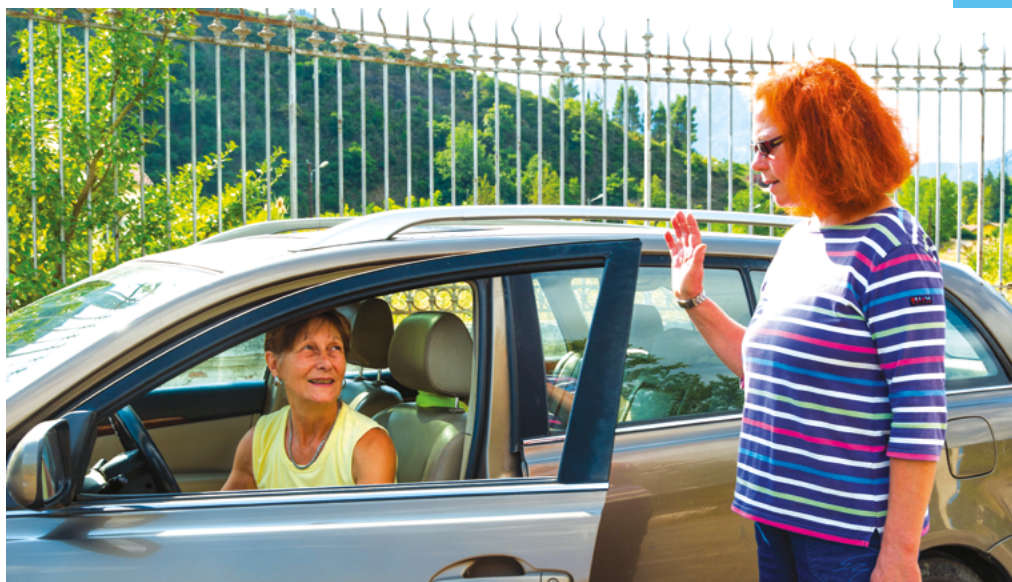
Association de co-voiturage La trame - Quillan - Aude (11)