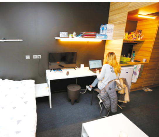
Résidence étudiante Simone Veil - Tarbes Hautes-Pyrénées (65)