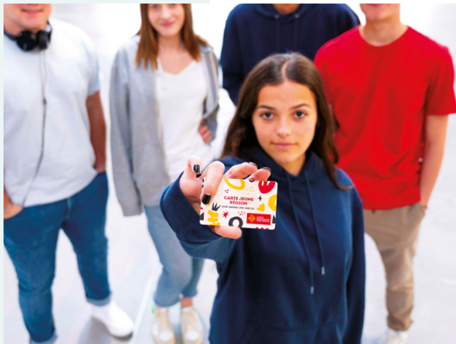
Étudiants et carte jeune région Toulouse - Haute-Garonne (31)