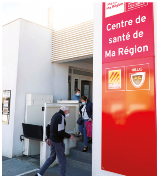
Millas - Pyrénées-Orientales (66)