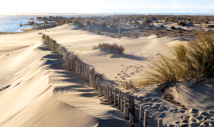
Plage de l'Espiguette - Gard (30)