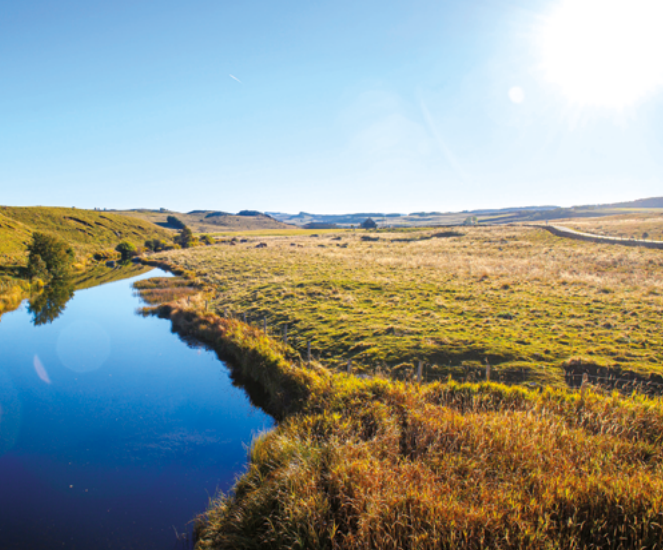
Pont de Marchastel - Lozère (48)