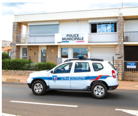
Poste de police municipale - Valras-Plage - Hérault (34)