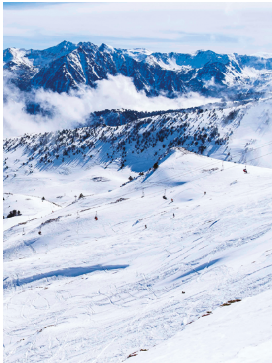
Station de ski Ax 3 Domaines - Ax les Thermes - Ariège (09)

Les montagnes d'Occitanie occupent plus de la moitié du territoire régional et rassemblent 1 habitant sur 5. Elles représentent une grande diversité tant physique que socio-économique et font face à des enjeux communs (écologique, énergétique, économique, sociétale, etc.). En lien avec le Parlement de la Montagne, la Région Occitanie porte une politique ambitieuse en faveur de ces territoires et se mobilise auprès de ses acteurs, en pleine complémentarité avec les autres instances intervenant pour la montagne et des opérateurs dédiés (Agence des Pyrénées, Compagnie des Pyrénées...). Le « Plan Montagnes d'Occitanie, Terres de vie » traduit la volonté partenariale avec l'État, la Caisse des Dépôts et les départements, d'un développement inclusif des territoires des Pyrénées et du Massif Central autour d'une stratégie tournée vers l'innovation. Pour chaque Massif, un Contrat plan interrégional État-Régions (CPIER) 2021-2027 définit des orientations stratégiques communes et fixe des engagements financiers importants pour leur développement, étroitement articulés avec les fonds européens.