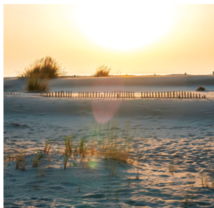
Plage de l'Espiguette Grau du Roi - Gard (30)

Direction de la mer (DirMer) Montpellier 04 67 22 94 39