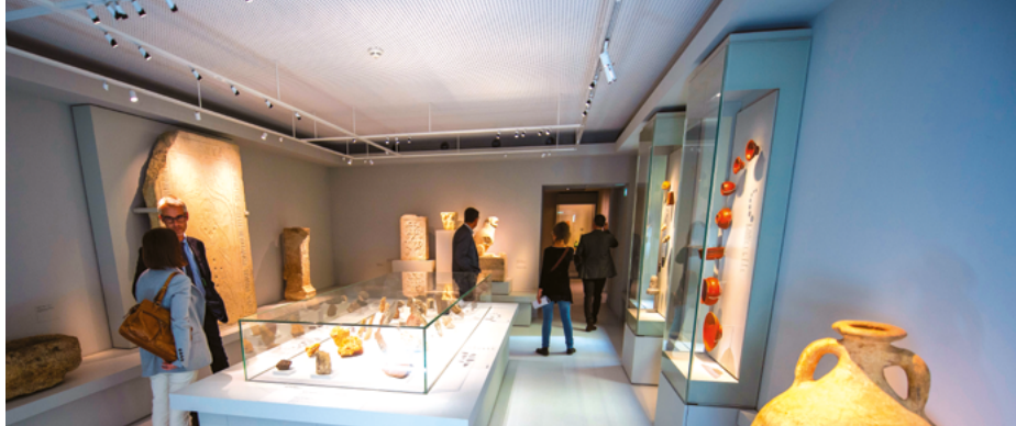
Inauguration du musée du Gevaudan - Mende - Lozère (48)