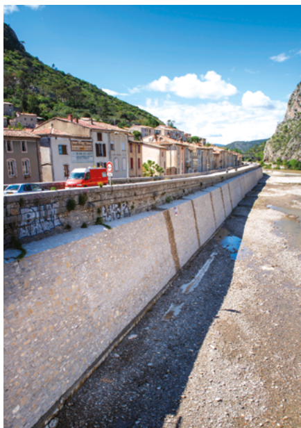
Rénovation des digues du Gardon d'Anduze - Gard (30)