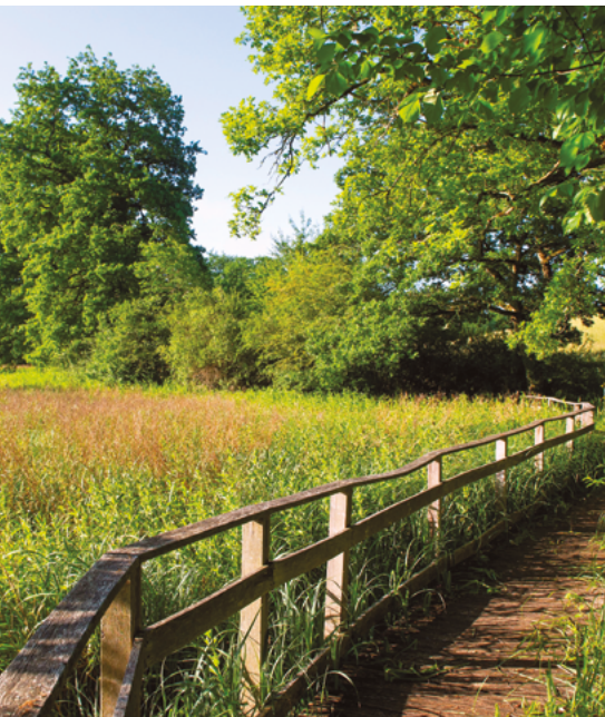
Parc naturel régional les Causses du Quercy Mayrinhac-Lentour - Lot (46)