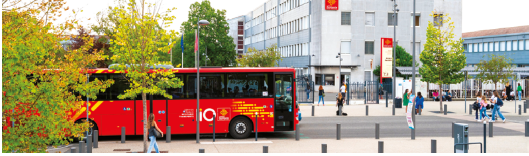
Lycée général et technologique Antoine Bourdelle - Montauban - Tarn-et-Garonne (82)